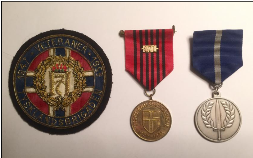
Deltagermedaljer fra Tysklandsbrigaden

fikk besøke kasernen i Høxter som nå tilhører en tysk rekruttskole. Han fikk også besøke Bergen-Belsen som nå er et museum og et minnes-merke over en forferdelig del av krigshistorien. Å oppleve disse stedene nå, uten krigsruiner og uhygge, mildnet nok noe av hans reaksjoner etter en svært spesiell militærtjeneste.