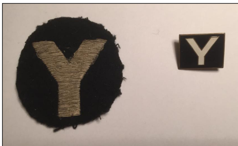
Utmerkelse fra Yorkshire Division