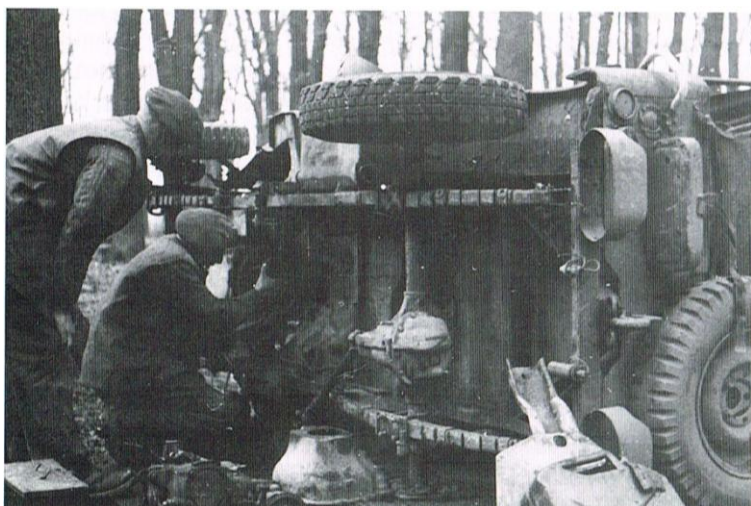
Bilreparasjon i felt.