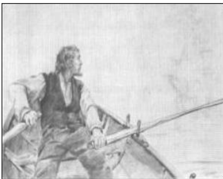
Tegning av Christian Krogh