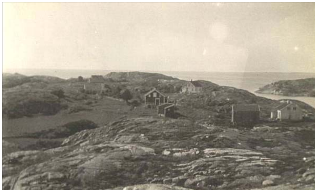
Loshusene på Haaø i 1920. På øya bodde på det meste 44 fastboende.