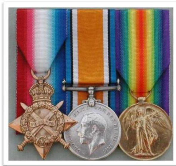
Star, British War og Victory medals.