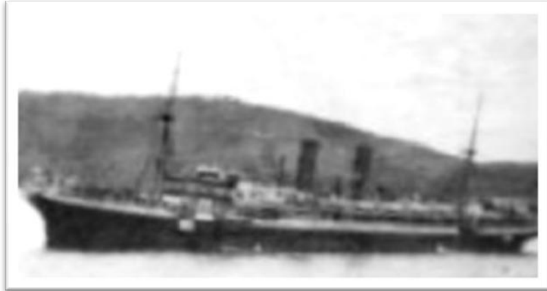
HMAT Miltiades ( http://alh-research.tripod.com/ships_lh.htm )