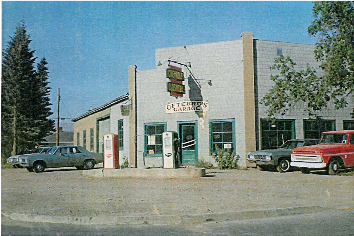
Oftebro's Garage i Preeceville, Saskatchewan, Canada.